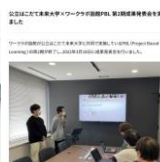
はこだて未来大学 PBL 記事