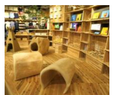
はこだてみらい館