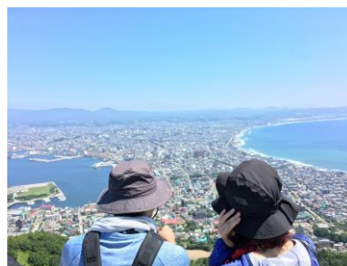
<函館山ハイキング>