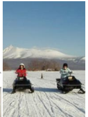
氷上スノーモービル体験