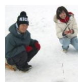
大沼わかさぎ 釣り体験